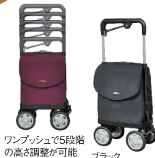
ワンプッシュで5段階の高さ調整が可能

●完成寸法:幅20×奥行き38×高さ64～86cm●バッグ寸法:幅14.5×奥行き29×高さ33cm●材質:フレーム/アルミ・合成樹脂、バッグ/ナイロン、車輪/EVA樹脂(13.5cm)●バッグ容量:12ℓ●重量:2.4kg