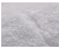
肌触りのよいミンク調の ボア裏地