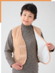
さっとはおりやすい チョッキタイプ

●品質:(表地)ナイロン100%、(内綿)ポリエステル100%、(ボア地)アクリル100% ●カラー:ベージュ ※このカラーは変わることがあります。 <27-030-02>