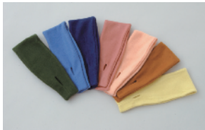
グリーン・サックス・ブルー・ローズ・ ピンク・ブラウン・イエロー