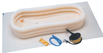
お部屋を濡らさない、うれしい防水シート付き