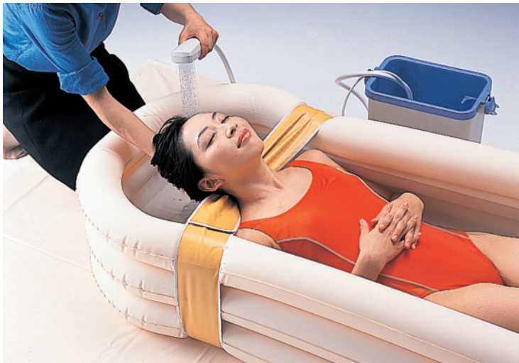
付属の洗髪ベルトを使えば、髪も洗えます

お風呂場まで行くのが困難な方でも室内でゆつくり入浴できる浴槽「ニュー湯つくくん」。ポンプで空気を入れ、膨らませるだけで室内で簡単に使用できます。コンパクトに畳めるので、持ち運びや収納の邪魔になりません。軽くて丈夫なポリウレタン製。全長180cmとゆったりサイズ、ソフトな肌ざわりなので、ラクな姿勢で心地よく入浴できます。お湯が飛んでも周りが濡れない防水シートも付けるなど、細部にまで配慮。四方から洗ってあげられるので、介助する方にとっても嬉しい商品です。