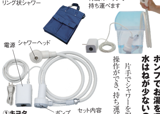
付属のバッグで 持ち運べます