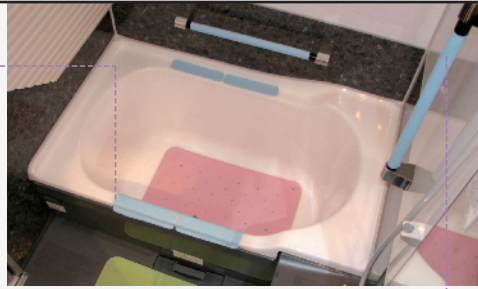
すべりやすいお風呂場の転倒予防に

●DSK5:5×48cm(14枚)●DSK10:10×48cm(7枚)●厚み:0.12cm●材質:[本体]天然ゴム、SBR、EPDM、[粘着部]プチールゴム