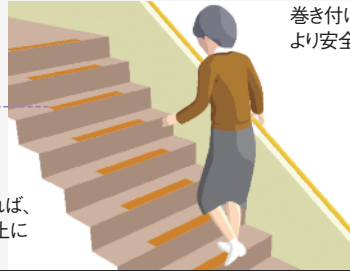
階段の幅・サイズに合わせて設置可能